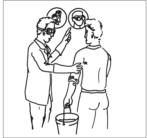
1 Die Instruktion des Personals ist für die Gewährleistung der Sicherheit von grosser Bedeutung.