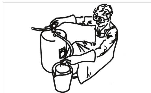
6 Umfüllen mit Handpumpe