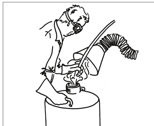
4 Absaugung ätzender Dämpfe