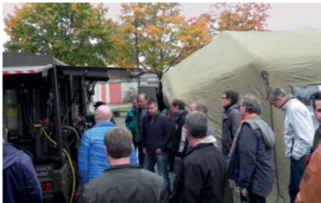
Notversorgungsmaterial der Armee

Bei Ausfall der eigenen Aufbereitung oder Mangellage von Trinkwasser muss schnell eine Alternative her. Die Rekrutenschule präsentierte das Notversorgung/ABC Material der Armee. Weiter wurden zwei Mobile Aufbereitungsanlagen der IWB vorgestellt. Diese wurden von der Firma Mebratec geplant und entwickelt. Es handelte sich um eine Ultrafiltrationsanlage und einer Anschwemmfiltration. Die Aufbereitungsleistung beträgt zwischen 220-240 m 3 / pro Tag.