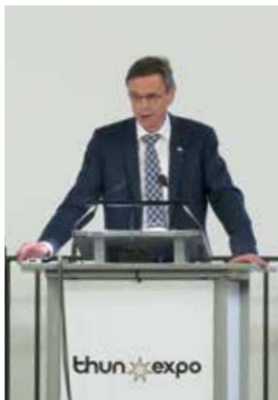
Links: Grundwasserpumpen Amerikaegge Rechts: Regierungsrat Hans-Jürg Käser