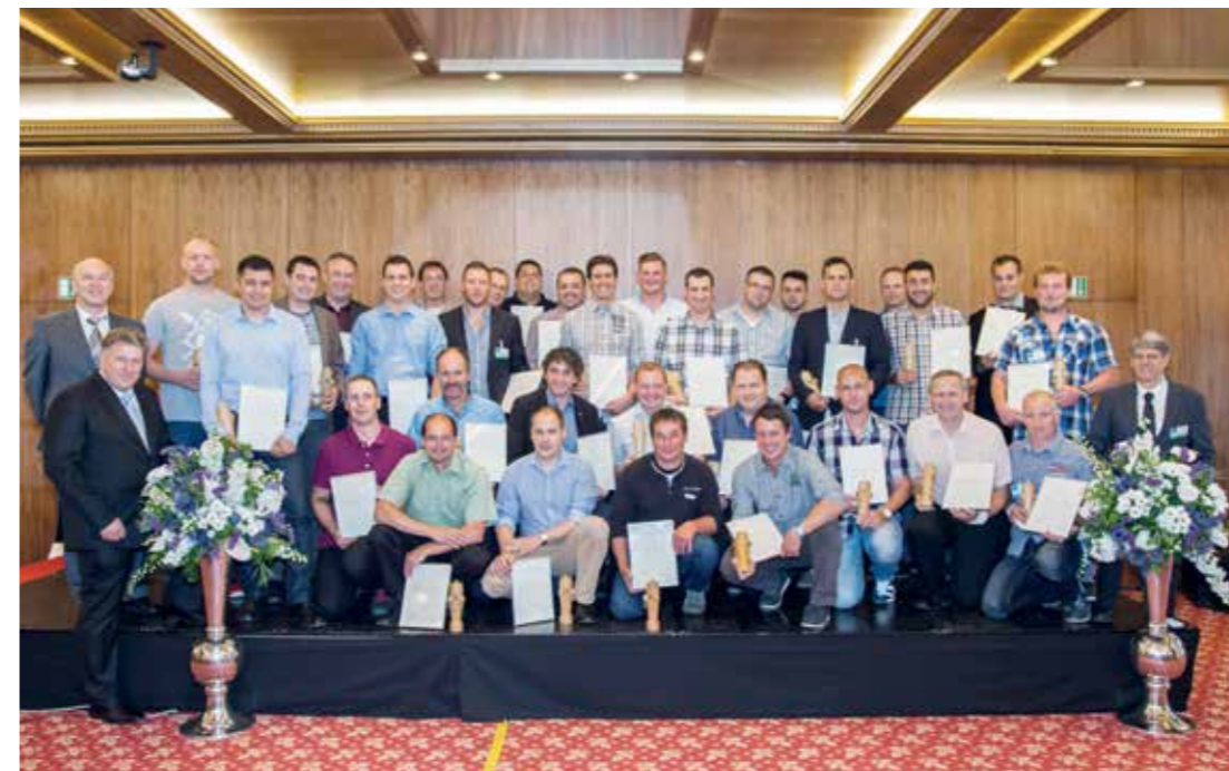
Brunnenmeister mit eidg. Fachausweis, Jahrgang 2014