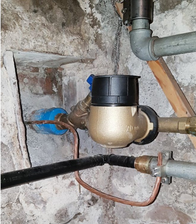
Ersatzerdung an Wasserleitung nach Ersatz der Hausanschlussleitung