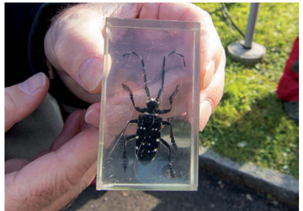
Jahresabschluss Vorstand, Laubholzbockkäfer