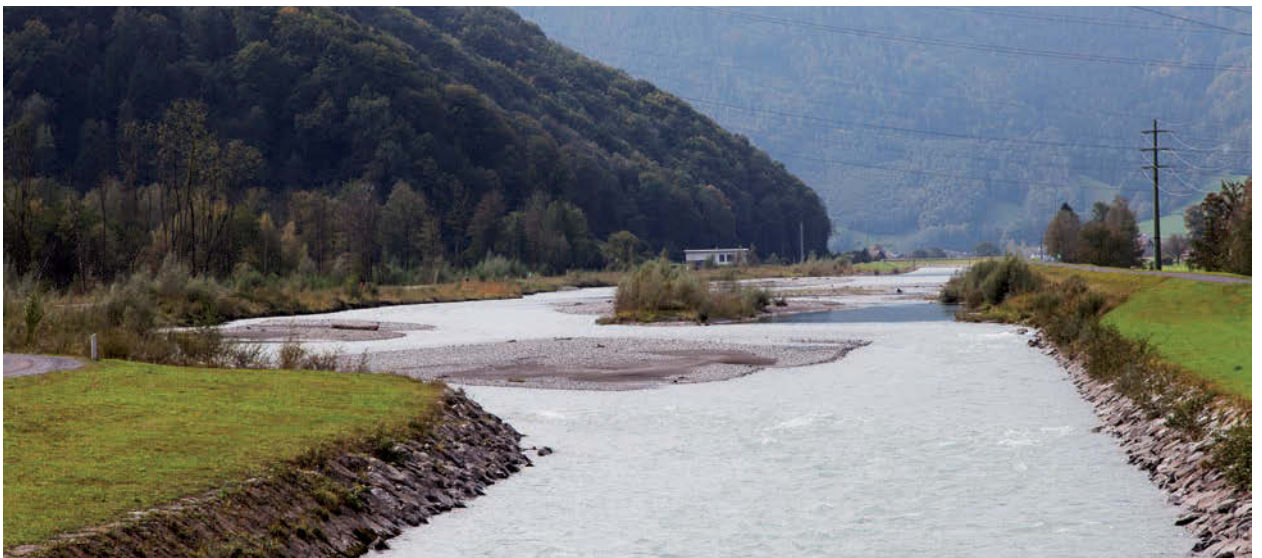
Herbsttagung Näfels, Linthkanal nach der Korrektur