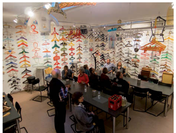
Jahresabschluss Vorstand, Kleiderbügelmuseum Birsfelden BL