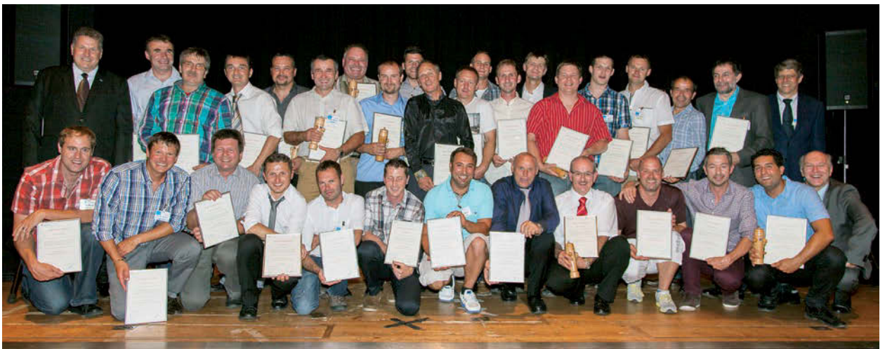
65. GV, erfolgreiche Brunnenmeister mit eidg. FA, Lehrgang 2013