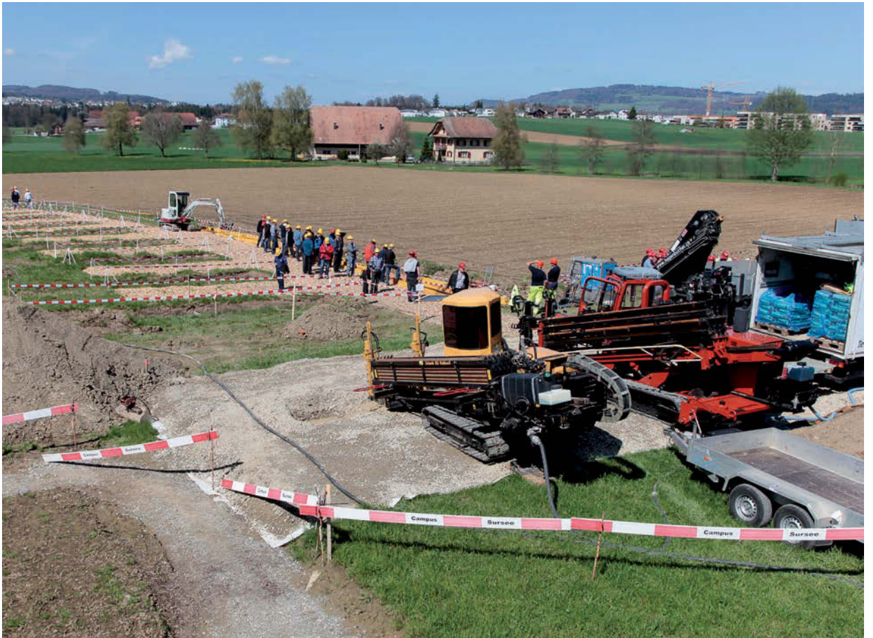
Weiterbildungskurs Campus Sursee, Grabenloser Leitungsbau, Demonstrationsgelände