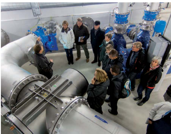
Jahresabschluss Vorstand, Aufbereitungsanlage der Hardwasser AG