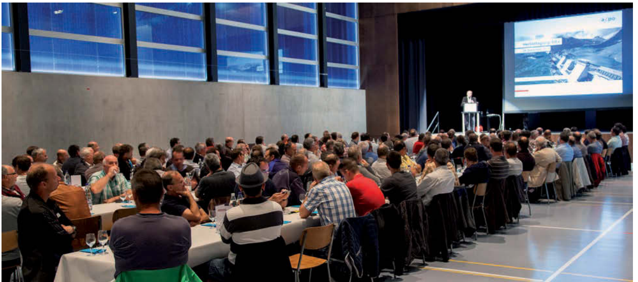
Herbsttagung Näfels, Referate