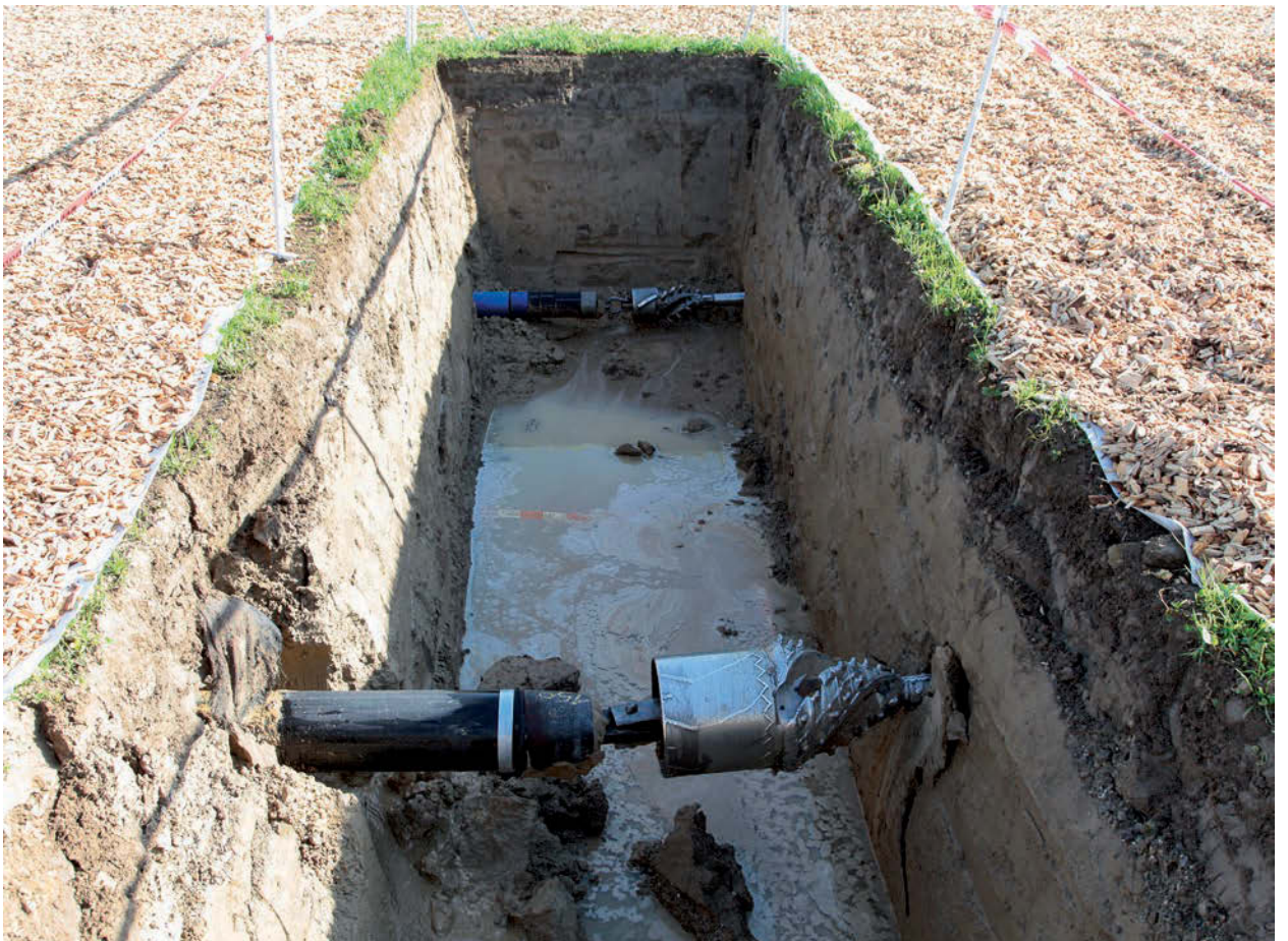
Weiterbildungskurs Campus Sursee, Grabenloser Leitungsbau, einer von 15 Gräben