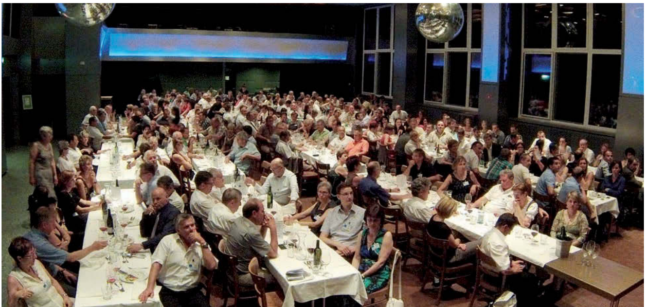
65. GV, Bankettabend im Hotel Murten